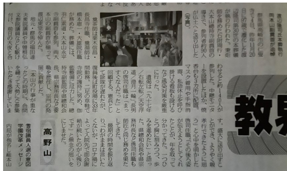
本葬新聞記事 (仏教タイムス)