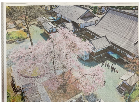
五輪桜をドローン撮影した新聞記事

例年よりも10日ほど早く開花した仁叟寺五輪桜。本年は上毛新聞社会面にドローン撮影した動画を含んだ記事として大きく紹介され、コロナ禍にも関わらず多くの参詣者が当山に見えられました。