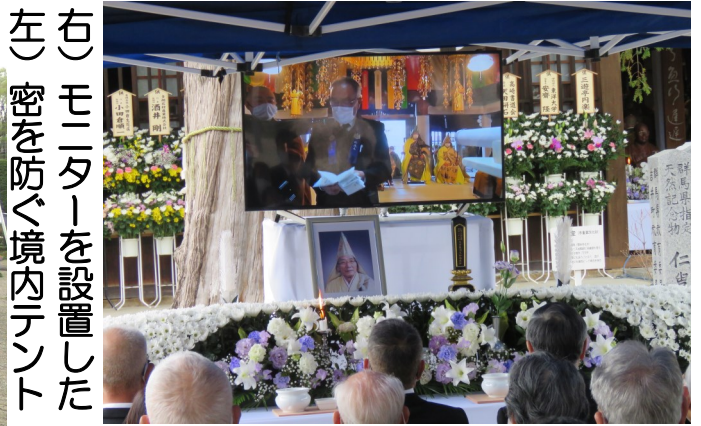
左) 密を防ぐ境内テント 右) モニターを設置した

コロナ禍の状況の中、出来る限りの対策を施しました。密を防ぐ為、境内にもテントを張り、それぞれに祭壇を組み、モニターを設置。本堂内も間隔を空け、全て椅子席としました。またマスク着用、空気清浄機及び次亜塩素酸噴霧器を各所に配置、入場前の除菌消毒を行いました。準備いただいたJAアシストホール吉井様、参列皆様方のご協力、有難うございました。