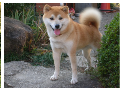
↑在りし日のロン太郎 ↙ペット供養納骨塔