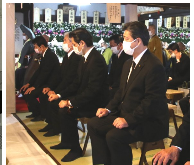
来賓の国会議員各位