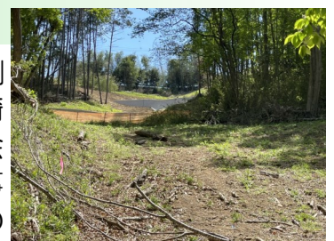
復旧工事が進む龍源寺

住職を勤めます龍源寺の人災被害ですが、コロナ禍の状況ゆえ、公判も迅速には進んでおりません。群馬県環境森林事務所による調査、高崎市環境部産業廃棄物対策課の行政指示により、被告多野造園土木株式会社による廃棄物全量撤去も行われ、当被災が人為的な要因で発生した事は、誰の目からみても明らかであります。墓石塔始め墓地、境内地等の原状回復を第一に、被災した檀信徒各位と共に精進をいたします。