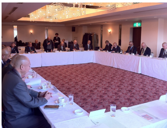
↑2月に開かれた總和会関東理事会議にて挨拶をする住職

来たる6月6日（木）～7日（金）に掛けて、第58回總和会関東大会群馬大会が、渋川市ホテル天坊において開催されます。当日は約400名程の山梨県を含めた関東地区一都七県のご寺院様が集い、研修会が開かれます。