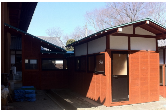
↑ 新築した鳳寿堂渡り廊下と東司