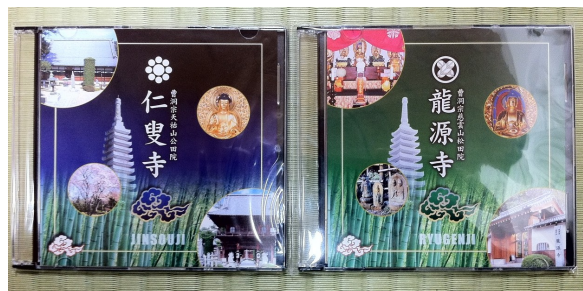
↑ 仁叟寺及び龍源寺紹介DVD

なお、仁叟寺の末寺で副住職の住職地である龍源寺（多胡）の紹介DVDも併せて完成いたしました。仁叟寺及び龍源寺紹介DVDは、一枚500円で頒布しております。ご希望の方は、当山までお問い合わせ下さい。