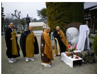
← 十二月に行われた開眼会法要 → 建立された大授戒会記念碑