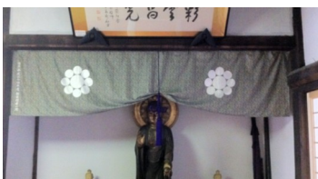
← 寺紋幕 →