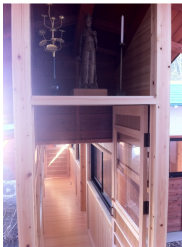
↑ 左) 渡り廊下内部