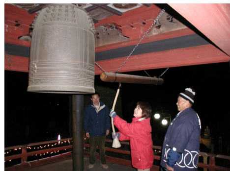
← 百八の煩惱を払う (除夜会)