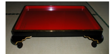
↑ 金縁朱面黒塗猫足供台