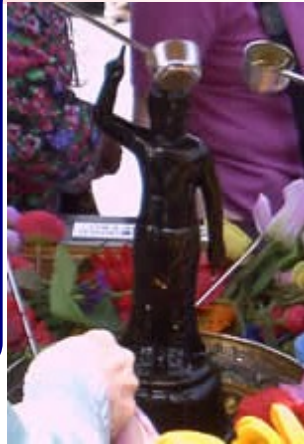
四月八日は、 仏様の誕生日