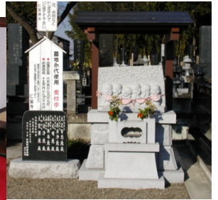
新墓地六地藏尊一式