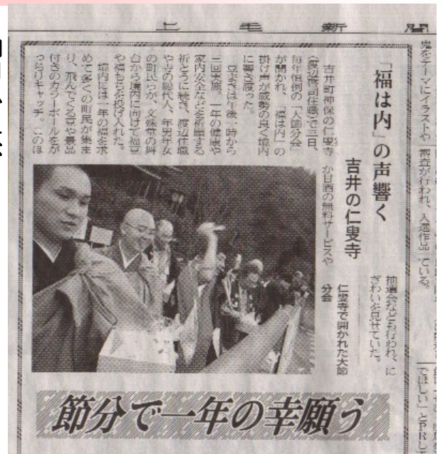
↑上毛新聞(2/4号)記事よ

今年も恒例の仁叟寺除夜会(12/31~1/1)、大節分会(2/3)が世話人総代人はじめボランティアお手伝いの皆様方の協力のもと、無事厳修することができました。年々盛会になっていく同行事ですが、今年はそれぞれおよそ2,000~3,000人ほどの参拝者の方々に賑わいました。特に大節分会では、地元の代議士である中曽根弘文参議院議員のご臨席も賜り、厄を払い福を呼ぶこの行事に参加して頂きました。仁叟寺護持会の皆様はじめ関係者各位に改めて厚く御礼申し上げます。次第です。