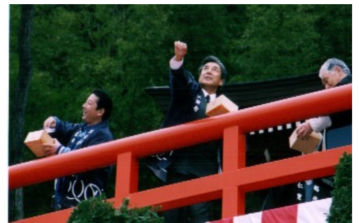
→ 『福は内!』 (大節分会)

今年も恒例の仁叟寺除夜会(12/31~1/1)、大節分会(2/3)が世話人総代人はじめボランティアお手伝いの皆様方の協力のもと、無事厳修することができました。年々盛会になっていく同行事ですが、今年はそれぞれおよそ2,000~3,000人ほどの参拝者の方々に賑わいました。特に大節分会では、地元の代議士である中曽根弘文参議院議員のご臨席も賜り、厄を払い福を呼ぶこの行事に参加して頂きました。仁叟寺護持会の皆様はじめ関係者各位に改めて厚く御礼申し上げます。次第です。