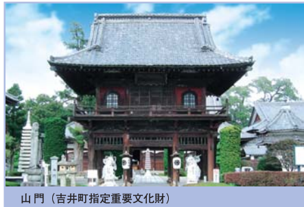
山門（吉井町指定重要文化財）